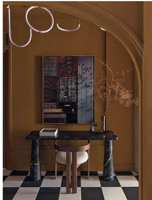
1/ Table Jupiter de Studioepepe (Baxter). Chaises Pigreco de Tobia Scarpa (Tacchini). Céramiques Pablo and Dora de Studioepepe (Tacchini). Suspension Moonstone Dome de Giopato & Coombes. Banquette de la collection « Modern Line », design Greta M. Grossman (Gubi). Au mur, tapis Talisman de Studioepepe (CC-tapis). Tableau de Zanele Muholi (Manifesta). Peinture Ressource. 2/ Dans la cuisine Bulthaup, carrelage Primitiva de Studioepepe (Ceramica Bardelli). Sculpture en bronze de Georges Yassef (Manifesta). Vase Rocchetto en céramique d'Ettore Sottsass (Bitossi). Coupe de Pierre Casenove. 4/ Coin bureau dans le couloir de l'entrée avec console Eros d'Angelo Mangiarotti (Agapecasa). Chaise Pigreco de Tobia Scarpa (Tacchini). Vase Pi-Dou , design Alvino Bagni (réédition Tacchini). Vide-poche Waterfall en marbre, design Dan Yeffet (Collection particulière). Suspension Unseen , design Studioepepe (Petite Friture). Photo « Palm Springs » The Family Visit, Still Life I d'Erwin Olaf (Manifesta / galerie Rabouan Mousson).